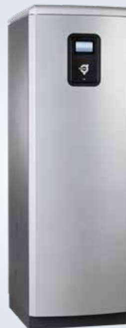
Diplomat Inverter Duo